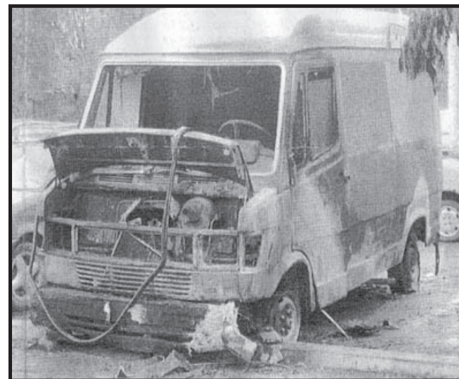
I resti del furgone della pellicceria "Del Mago" a Fidenza, adesso chiusa definitivamente

che ogni gruppo di azione fa in base alle sue idee e alle prospettive dell'azione che compie in quel momento. Allo stesso modo l'uso della firma ALF in alcuni casi può far pensare di essere nel mirino di qualcosa di grande e non di un qualsiasi gruppo di persone che hanno passato una notte a liberare