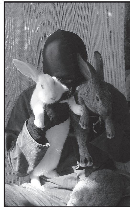
Luglio 2005. Due dei 210 conigli liberati da "Pmpaloni" a Fauglia, Pisa, riproduttore per laboratori e per macelli.

scavalcare o tagliare per avere un accesso e una rapida via di fuga. Non fatevi spaventare dal filo spinato, facilmente scavalcabile se avete abiti e guanti pesanti e una certa agilità. Se dovete abbattere una recinzione per fare uscire gli animali il metodo più veloce è quello di tagliare dall'alto in basso due estremità alla distanza che sceglierete e poi staccare la rete da ogni palo su cui è legata con dei ganci. In questo modo la rete cascherà a terra e avrete dovuto fare solo due tagli per decine di metri di rete, risparmiando molto tempo. Abbiate poi l'accortezza di schiacciarla bene sul terreno, per favorire il passaggio degli animali e anche il vostro, in caso ci sia una fuga precipitosa non sarebbe piacevole inciamparci!