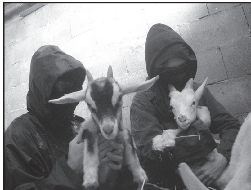
Due dei 12 capretti liberati da una fattoria sperimentale dell'Università di Milano nell'aprile 2006.

sostegno, sia legale che economico e morale. Una persona che viene arrestata nella lotta per la liberazione animale ha molti amici, compagni, sostenitori e simpatizzanti che ne chiederanno il rilascio e faranno sentire la loro vicinanza.