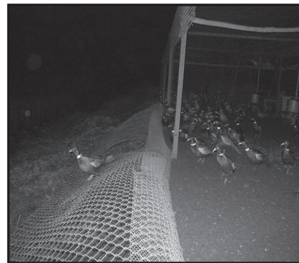
Fagiani in fuga dal "Centro di educazione ambientale" di Pesaro, marzo 2009.

Ricordatevi inoltre che la regola d'oro del sopralluogo è non lasciare