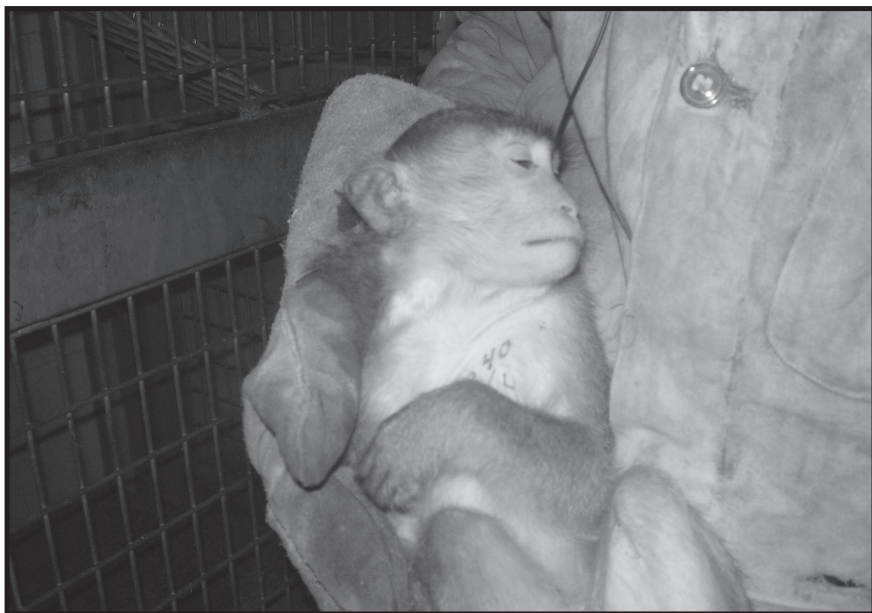
Uno dei 18 macachi liberati dall'allevamento Harlan di Correzzana (Mi) nella notte del 20 novembre 2006

Informatevi sulla presenza di allevamenti nella vostra zona e cominciate a conoscerli, mapparli, visitarli e infine svuotarli!