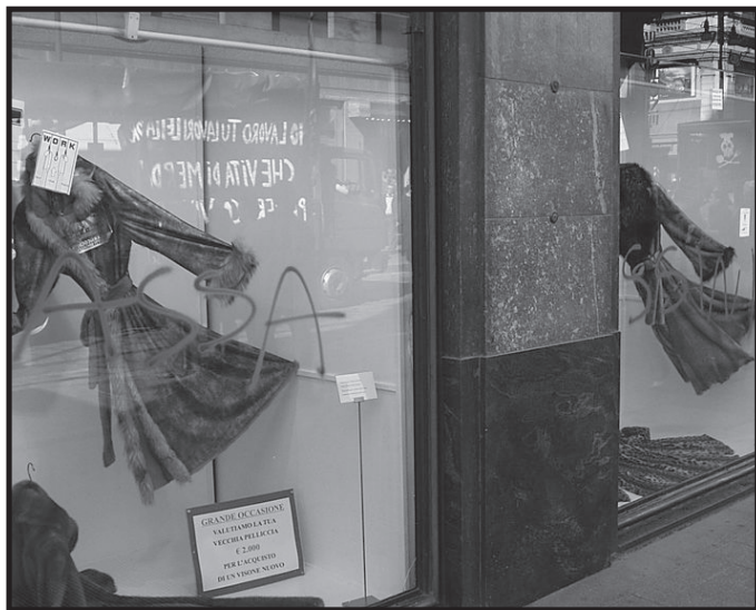
Scritte sulla pellicceria Levi a Milano durante la Mayday del 2004. In seguito a molte altre azioni la pellicceria ha chiuso.

Questa lotta contro Zoolandia e altri esempi di pelliccerie che hanno chiuso in seguito alle azioni dirette sono un messaggio eloquente: l'azione diretta è efficace!