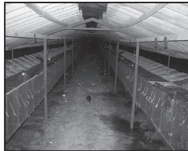
Gabbie aperte e migliaia di visoni liberi a Castel di Sangro (AQ), settembre 2009

e portandosi via 6 porcellini d'india dentro una giacca, portò ad un inaspettato ed immediato risultato: la proprietaria dell'allevamento decise di chiudere per timore di ulteriori azioni!